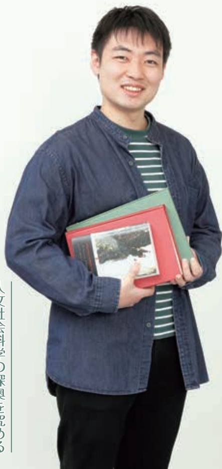
人文社会科学の深奥を究める