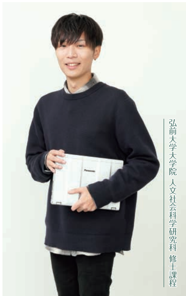
弘前大学大学院 人文社会科学研究科 修士課程